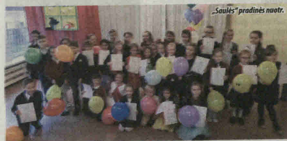
„Saulės“ pradinės nuotr.