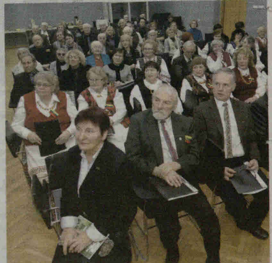
Metų pabaigoje Lietuvos politinių kalinių ir tremtinių sąjungos Šiaulių filialo nariai sukviėtė į bendrą renginį, kuriame paminėjo keturias progas.