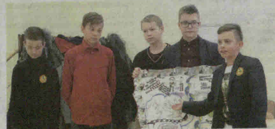
Šiaulių rajono mokinių pilietinių iniciatyvų konferencijoje „Antikorupcijos laboratorija“ mokiniai išradingai analizavo korupcijos priežastis ir pasekmes.