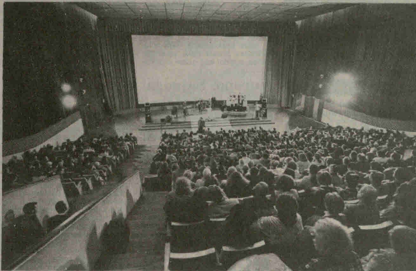
Biblijos žiemos seminaro metu nė vienos kėdės salėje nebuvo tuščios.