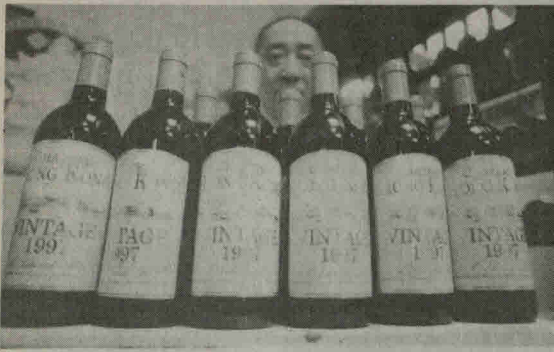
Kinijai perimant Honkongą, be kitų suvenyrų, buvo parduodamas ir specialiai šiam įvykiui sukurtas vynas "Chateau Hong Kong-Vintage 1997". Jo kaina - 110 Honkongo dolerių (apie 40 JAV dolerių) už butelį. Vynas paklausus iki šiol. Honkongo svaigalų parduotuvėje demonstruojamas 1997 metų sezono vynas.