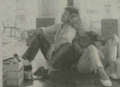
Jei muzikos klausomasi ramiai, tada ji veikia žmogų.