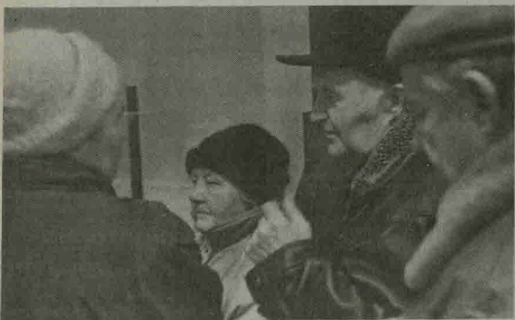
Tad gal teisūs tie žmonės, kurie teigia, kad „Telekomas“ net su teikdamas lengvatas moka pasipelninti?