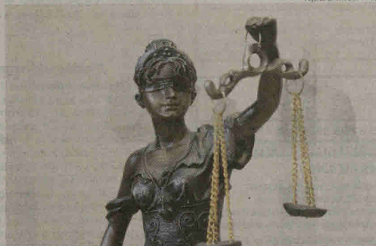
Teisinė sistema beveik dvejais metais išblaškė mamą ir du jos vaikus.

Moteris pasakojo, kad susitikimo metu berniukas teigė, jog ji ligoninėje mušė sanitaras – sudavė jį galva, kaklą, vadino įvairiais žodžiais, o kad būtų ramesnis jam suleidavo vaistų. Vaikas aiškino,