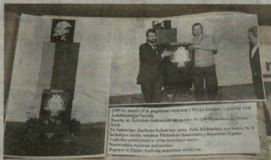
Nuotraukoje – 1989 metų sausio 15 dienos rinkimų balsavimo urna Šiaulių miesto Žemaitės rinkiminės apygardos apylinkėje.