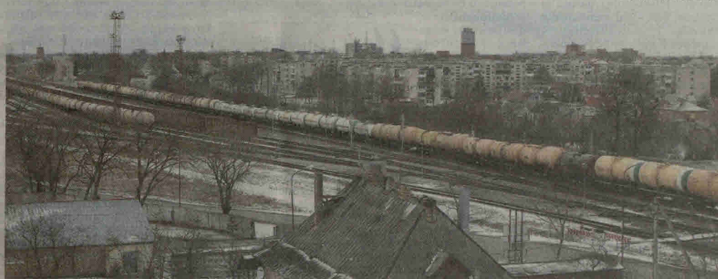
Gerovės paieškų tyrimuose ir akivaizdžiai matomi dideli skirtumai.