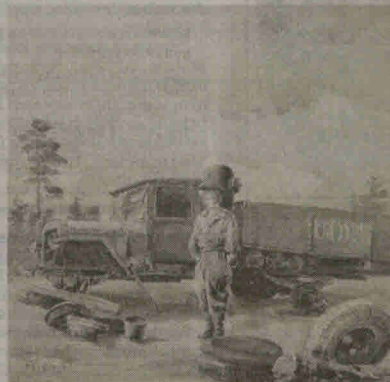
Krasnojarsko kraštas (Rusija). Automobilio remontas. Akvarelė. 28,5x26, 1953 m.