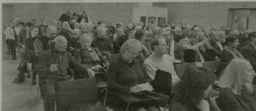
Į knygos pristatymą susirinko didelis būrys šiauliečių.