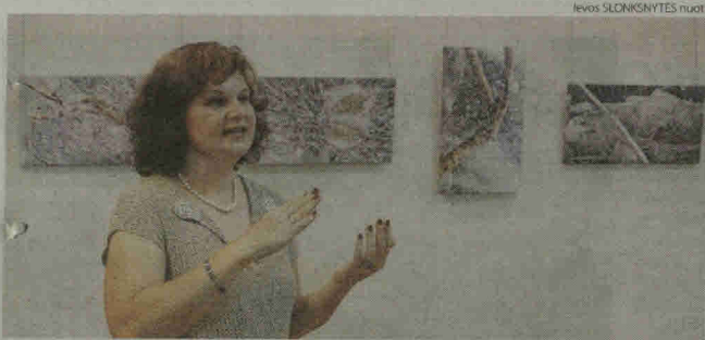
Audronės Grigorjevičienės fotografijų paroda „Ledo poezija“.