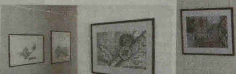
Eglės Bičkienės kūrinų tematika siejasi su Lietuvos kultūriniu paveldu, gamta, liaudies meno ornamentika, etnografiniais motyvais.