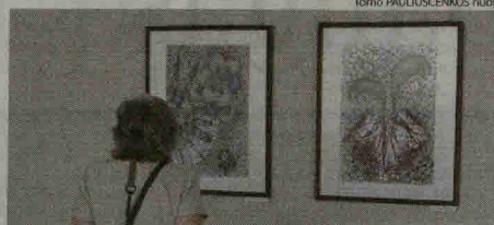
Šiaulių apskrities Povilo Višinsko bibliotekoje veikia Eglės Bičkienės grafikos darbų paroda „Toks matymas“.