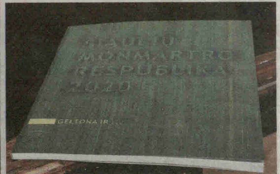
Parodą „Geltona ir...“ lydi katalogas.