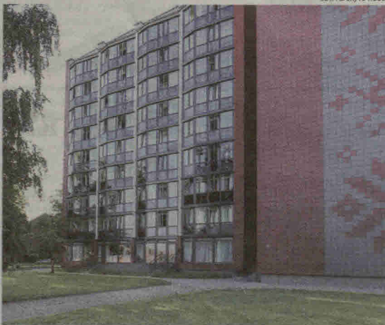
Daugiabučių renovacija Lietuvoje.

Antrasis kvietimas – teikti paraiškas atsinaujinančios energijos šaltiniams įrengti daugiabučiuose namuose, kurie nėra prijungti prie