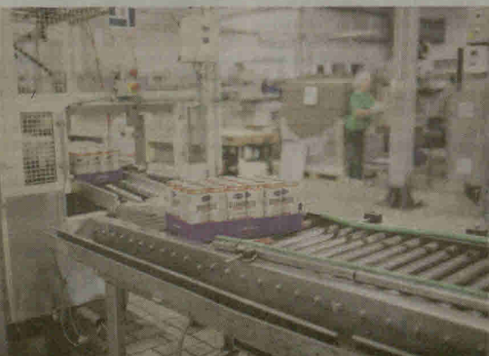
Kampanijoje dalyvauja ir Šiauliuose veikianti alaus darykla „Gubernija“.

Iš viso prekybos tinklo „Maxima“ iniciuotoje lietuviškos produkcijos kainų mažinimo kampanijoje „Išvien dėl Lietuvos“ šiuo metu dalyvauja 80 didžiųjų ir mažesnių Lietuvos gamintojų.