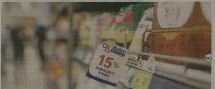
Atpiginta lietuviška produkcija „Maximos“ parduotuvėse yra žymimos geltonomis etiketėmis ir ženkliais „Išvien dėl Lietuvos“.

Taigi, pradėjome analizuoti patikimo į pagrindines elektronines komercijos platformas galimybes bei atidarėme savo elektroninę parduotuvę www.e-ruta.lt “, – pasako-