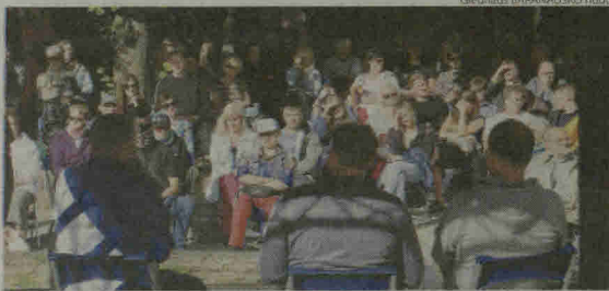
Šiauliuose, Gardino gatvės 7 namo kieme, žiūrovai klausėsi pokalbio-diskusijos „Humoras, kaip (iš)gyvenimo forma“.