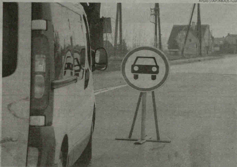
Kituose nedideliuose įvažiuimuose į Šiaulius pastatyti automobilių eismą draudžiantys ženklai.