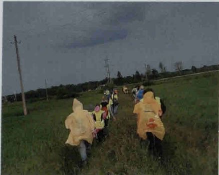
Žygio dalyviai nepabūgo blogų orų.