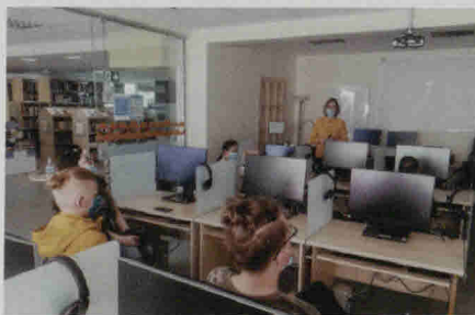
Edukacija Meninės fotografijos studijoje.

Kai nelyja ir vėtroms nurime, biblioteka kviečia į Kiemo galeriją pažiūrėti Kauno apskrities VB parengtos kilnojamosios parodos „Iš Laikinosios sostinės valdininko gyvenimo“, kūrybingumą galima ugdyti bibliotekoje veikiančioje Meninės fotografijos studijoje.