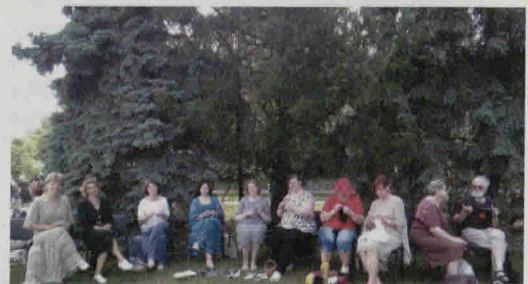
Prie akcijos prisidėjo ir mezgimui neabejingi miestėnai.

Patogiai įsitaisę su virbalais, vašeliais ir siūlų kamuoliukais, mezgimo entuziastai mezgė kojines, riešines, kokį aprangos aksesuarą ar žaisliuką. Praeiviai galėjo pasigėrėti ne tik ekspozuojama mezginių paroda „Siūlo suktybės“, bet ir susipažinti su mezgimui ir įvairiems raštams skirtais leidiniais. Kad mezgimas malšina stresą, didina kūrybingumą, gerina atmintį, lavina smulkiąją motoriką, patvirtina ir mokslas.