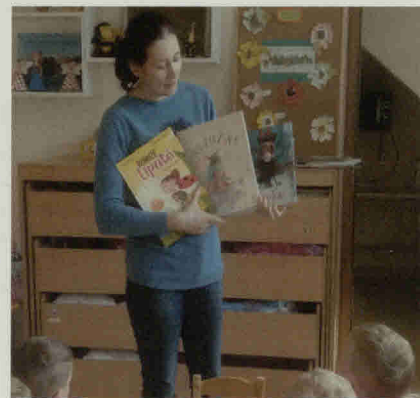
Rykantų mažiesiems surengtoje popietėje.

Rykantų universalus daugiafunkcio centro patalpose surengta popietė mažiesiems „Mūsų gimtinė“ buvo skirta Tarptautinei vaikų gynimo dienai (minimai birželio 2 d.), taip pat norėta priminti, kad šiemet Trakai – Lietuvos kultūros sos-