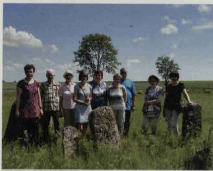
Klykolių žydų kapinaitėse.