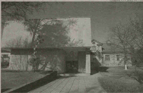
„Laiptų galerija“ devynis mėnesius bus rementuojama. Dabar dėliojama, kaip suderinti galerijos veiklą ir statybos darbus.

„Laiptų galerija“ atnaujinama už valstybės ir Savivaldybės biudžeto lėšas. Valstybės investicijų