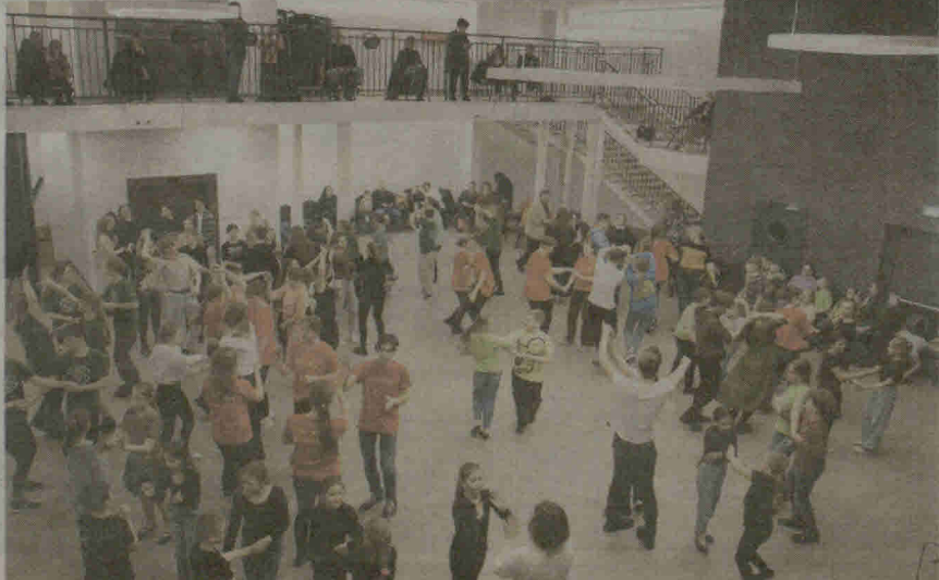
Folklorinių šokių vakaronė subūrė ir didelius, ir mažus.