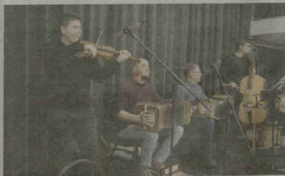
Vakaronėje linksmino Šiaulių Dainų muzikos mokyklos vaikų ir jaunimo folkloro ansamblio „Vieversėlis“ instrumentinė grupė.