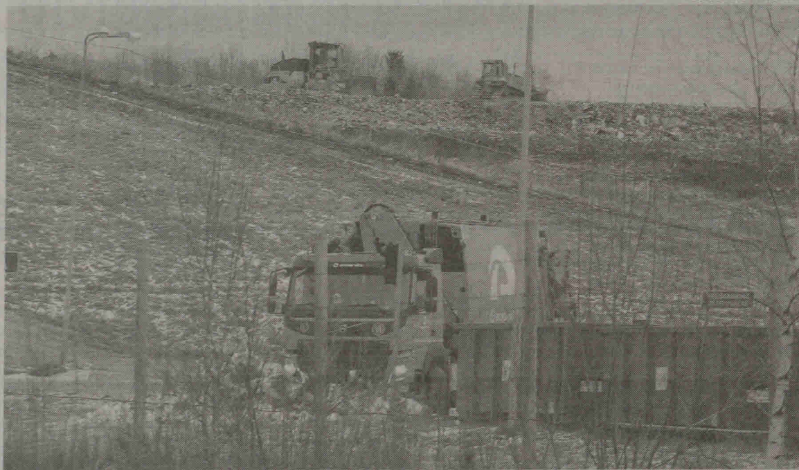
Šiaulių regiono atliekų tvarkymo centras jau pateikė popierines ir elektrones sąskaitas už buitinių atliekų išvežimą.